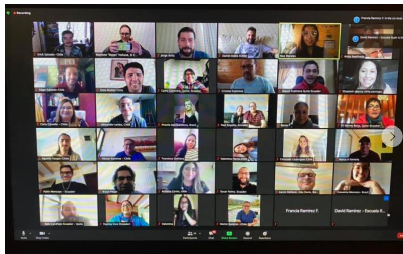
(RUAH trainers van heel latijns-amerika)