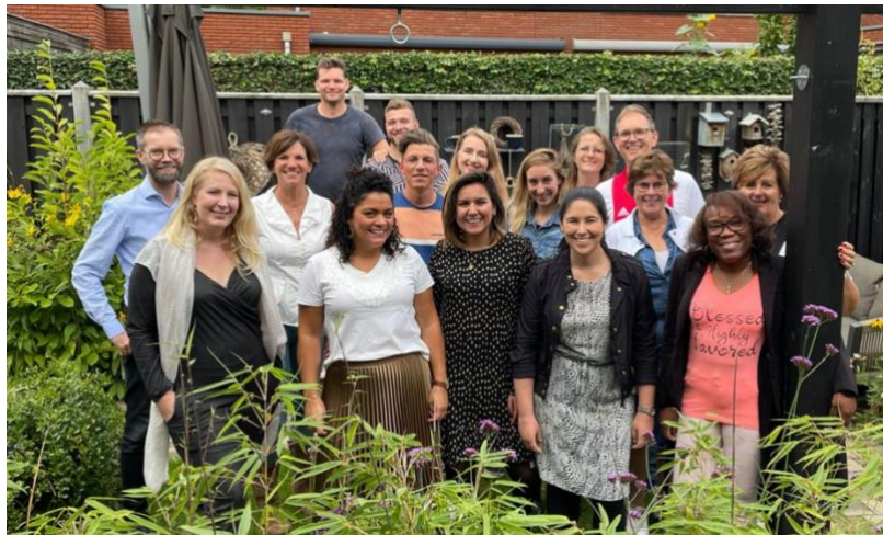
(RUAH Trainers op een team dag in NL)

We zien dat er meer aandacht vanuit kerken en bedieningen naar het helpen van prostituees gaat. We zijn vrouwen aan het helpen om uit te stappen maar ook andere organisaties aan het inspireren hoe zij ook mensen uit de prostitutie kunnen helpen.